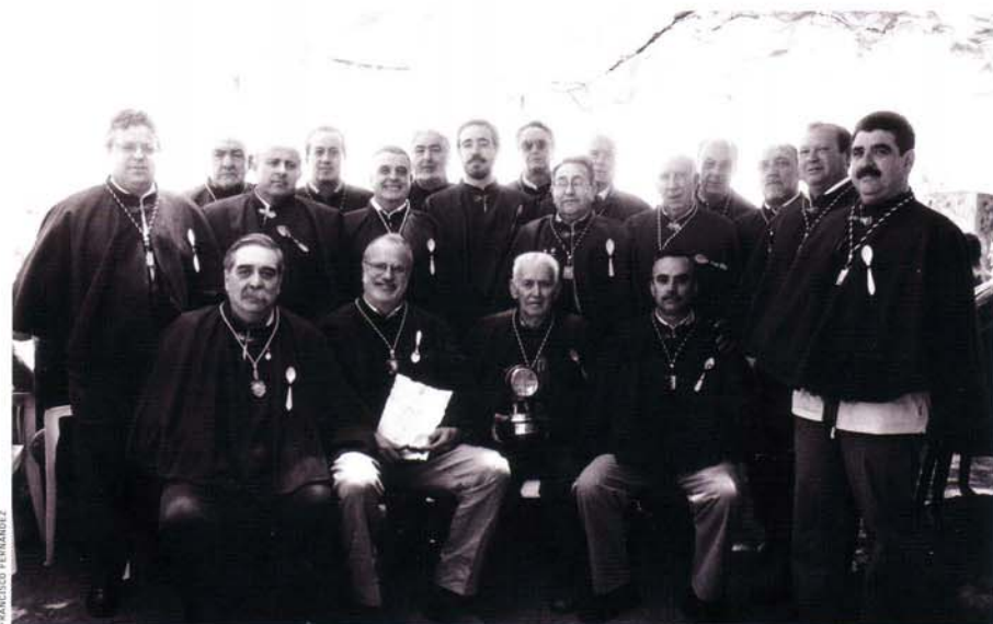
CUCHARA DE PALO, ORDEN DE LA. La institución gastronómica con sede en Guarromán defiende a ultranza la cultura del olivo y cada año distingue a personajes relevantes.

Cuando aquellos agricultores de olivos elevaban su cuchara de palo reivindicaban sus derechos forales, circunstancia que en dos ocasiones, entre 1767 y 1835, les fue negada al serles derogado el fuero, una de ellas durante la invasión napoleónica en el siglo XIX.